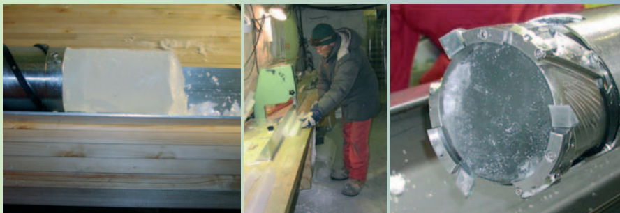
Iskerne på vej ud af boret