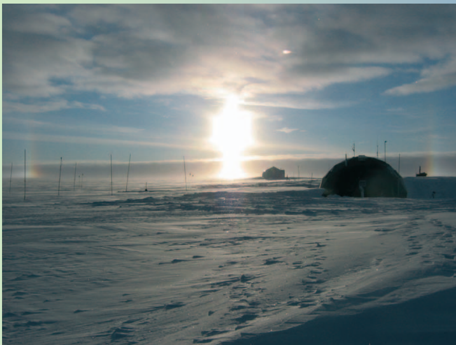
NGRIP-lejren på Grønlands indlandsis

Hæftet introducerer nogle grundlæggende naturvidenskabelige begreber og metoder og giver mulighed for samarbejde mellem alle de fire naturvidenskabelige fag, men der kan også laves forskellige undervisningsforløb, som vægter fagene forskelligt. Til hæftet er knyttet en hjemmeside, www.nfa.fys.dk , hvor det er muligt at finde yderligere datamateriale, forslag til undervisningsforløb, eksperimentelle undersøgelser, opgaver og uddybninger.